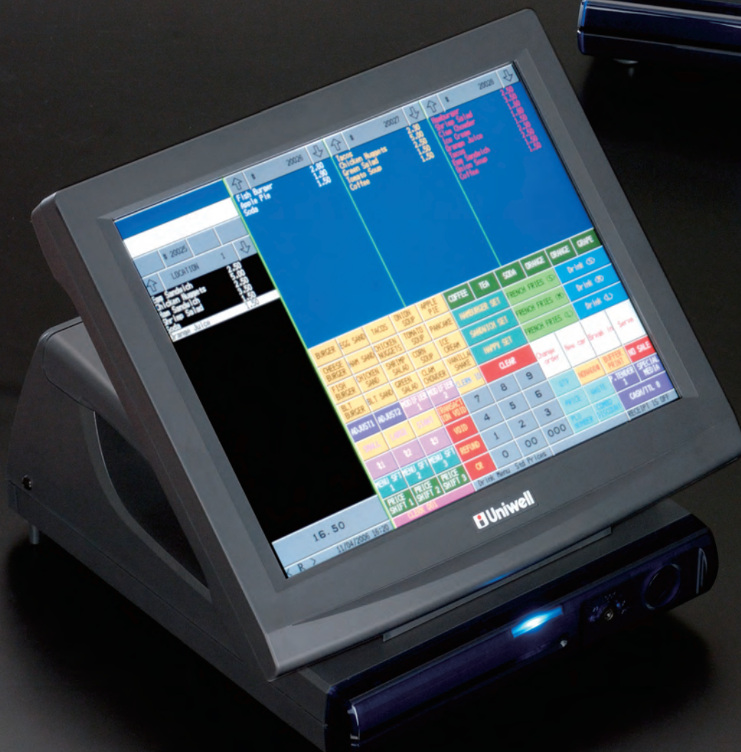
DX-915 15" Touch Screen