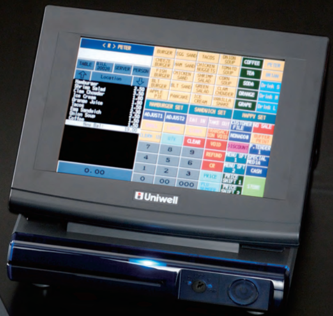
DX-895 10.4" Touch Screen

Die neuen Uniwell DX 915 / DX 895 Touch-Screen Kassen vereinen leistungsstarke Hardware und effiziente Software zu einem flexiblen System für alle Bereiche der Gastronomie.